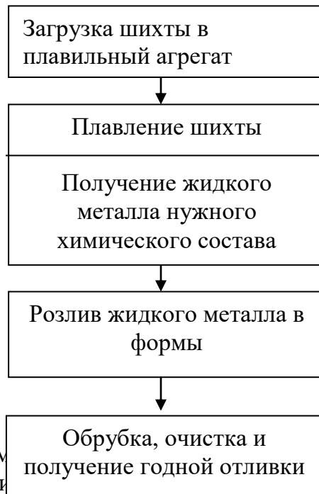
Рисунок 1 – Схема получения отливок. Массу отливки, литой определяют опытно-производственным методом. При этом количество одновременно взвешиваемых деталей зависит от массы каждой детали.

Особенности нормирования расхода материалов для литейного производства машиностроительных предприятий связаны с его четырёхфазным характером (рисунок 1).