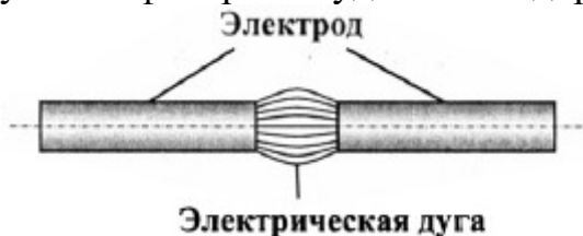
Рис.3. Принцип работы дуговой лампы

Во второй половине XIX века улицы европейских столиц освещались дуговыми лампами. Между двумя угольными стержнями (электродами) при подаче напряжения возникала электрическая дуга, давая яркий свет. Электроды располагали так, что их необходимо было сближать по мере их сгорания (рис. 3). Это требовало сложных устройств (регуляторов), которые делали электрическое освещение с помощью дуговых фонарей неудобным и дорогим.