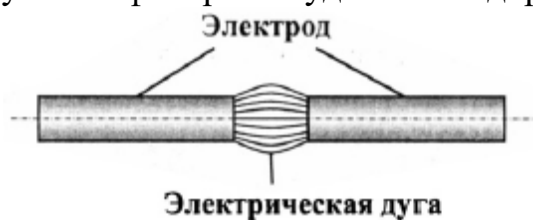
Рис.3. Принцип работы дуговой лампы

Это требовало сложных устройств (регуляторов), которые делали электрическое освещение с помощью дуговых фонарей неудобным и дорогим.