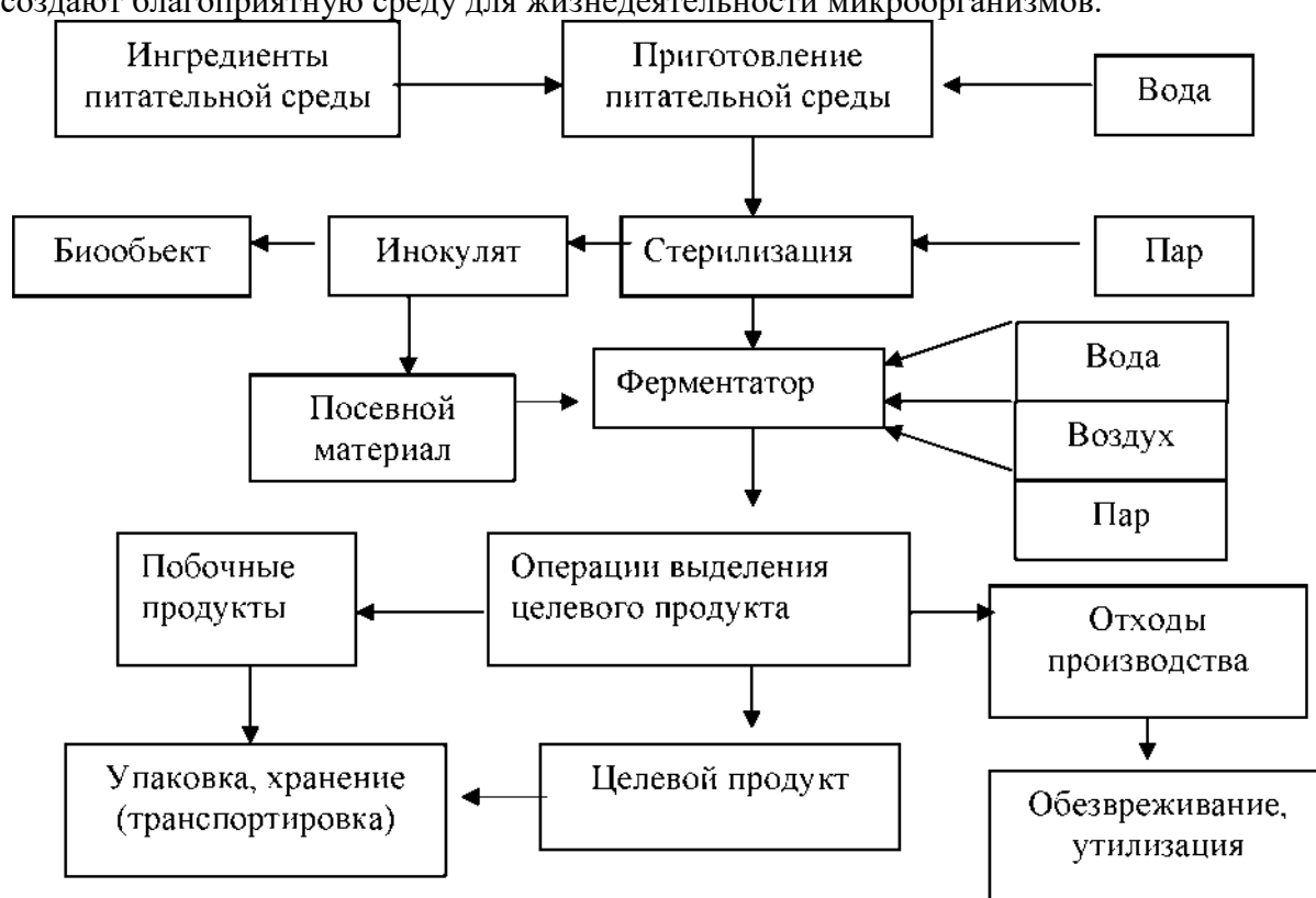
Рис. 1. Примерная обобщенная схема биотехнологических процессов

В производственных условиях источниками микроорганизмов-контаминантов могут быть почва, вода, окружающий воздух, люди. Наличие в воздухе частиц пыли или капелек влаги создают благоприятную среду для жизнедеятельности микроорганизмов.